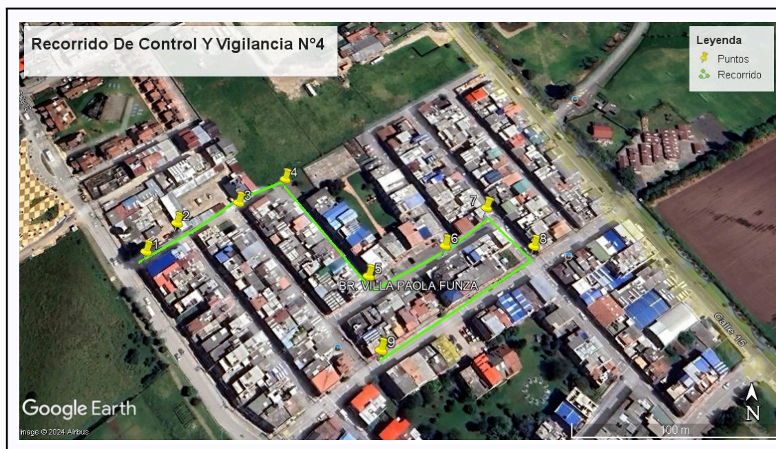
Ilustración 1. Recorrido de Control Y Vigilancia N°4

Con base en lo anterior, el día 15 de Agosto del 2024 se realizó recorrido de control y vigilancia en el barrio Villa Paola, cuadrante 3 desde las coordenadas 4°43'33.6" N- 74°13'10.644"W hasta las coordenadas 4°43'31.77" N- 74°13'6.39"W (ver ilustración 1. Ruta verde)