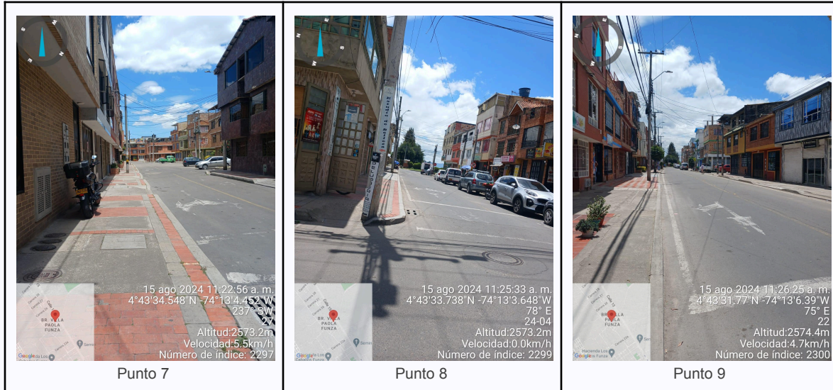
Ilustración 2. Fotos de los puntos del Recorrido de Control Y Vigilancia.